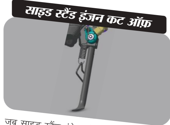
साइड स्टैंड इंजन कट ऑफ

जब साइड स्टैंड इंगेज हो और व्हीकल को गियर पर डाला जाए तो राइडर की सुरक्षा के लिए ये इग्निशन को कट ऑफ कर देता है।